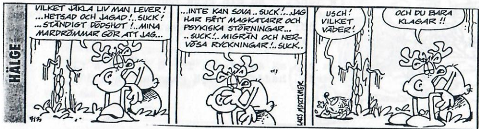
Saxat ur VF

ästansjö by skall även ha en skylt, just före byn, där det skall tä "VÄLKOMMEN TILL NÄSTANSJÖ" i någon form. Låt fantasin leka med r. Lämna in förslag till en sådan skylt senast 15:e november. å hinner vi presentera dessa i nästa byablad. Det spelar ingen oll om ni ritar bra eller mindre bra. Det är förslagen vi är ntresserade av.