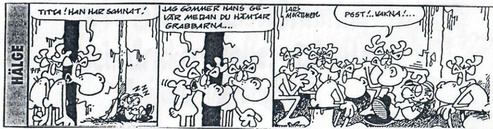
saxat ur VF